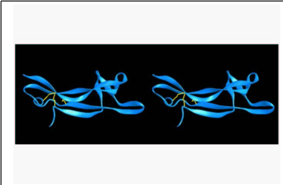
Fig. 1. Een schematische weergave van het eiwit Nerve Growth Factor (Homo Sapiens). Het driedimensionale karakter kan waargenomen worden door wat scheel naar de afbeelding te kijken (of juist door de figuur heen “naar de horizon te kijken” voor het spiegelbeeld effect) en dan de linker en rechter plaatjes te laten overlappen. Gereproduceerd met toestemming van het Swiss Institute of Bioinformatics , Peitsch et al. [1995]. ftp://ftp.expasy.org/databases/swiss-3dimage/IMAGES/JPEG/S3D00467.jpg

1. Eiwitten. Het eerste voorbeeld heeft als domein de verzameling eiwitten. Een eiwit is een molecuul bestaande uit een keten van aminozuren, waarvan er 20 soorten bestaan. De lengte van de keten zelf kan tot boven de duizend aminozuren oplopen. Omdat sommige van deze aminozuren elkaar aantrekken en andere elkaar afstoten ontstaat de ruimtelijke vorm die aan het eiwit zijn specifieke chemische betekenis geeft. Zo zijn er eiwitten die structurele bouwstenen zijn voor een levende cel, terwijl andere eiwitten een enzymatische reactie leveren, welke bijvoorbeeld nodig is voor de spijsvertering.